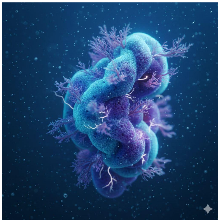
آوش (موجود خیالی)

داره... بهم می‌خنده؟ با دستم آب رو به جلو هل می‌دم تا خودم رو به عقب بکشم و بتونم برای اولین بار یه نگاه کامل به این «مرد دریایی» بندازم.